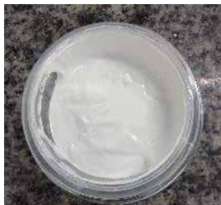
Óxido de Zinco (ZnO) + Agreen LSO Proporção: 4:1 (pó: emoliente)