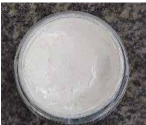
Dióxido de Titânio (TiO 2 ) + Agreen LSO Proporção: 3:1 (pó: emoliente)