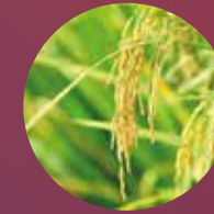
BioEsteroil Cera de Arroz